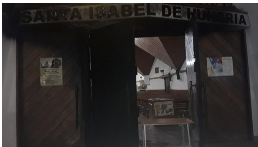
Así quedó la entrada de la parroquia.

"Cuando guardé mi auto una hora antes pasaron unas personas gritando hacia dentro, no entendí qué, pero gritaban con un poquito de violencia. Eso fue como a las 22:30 horas, como dos horas antes de esto", añadió el religioso.